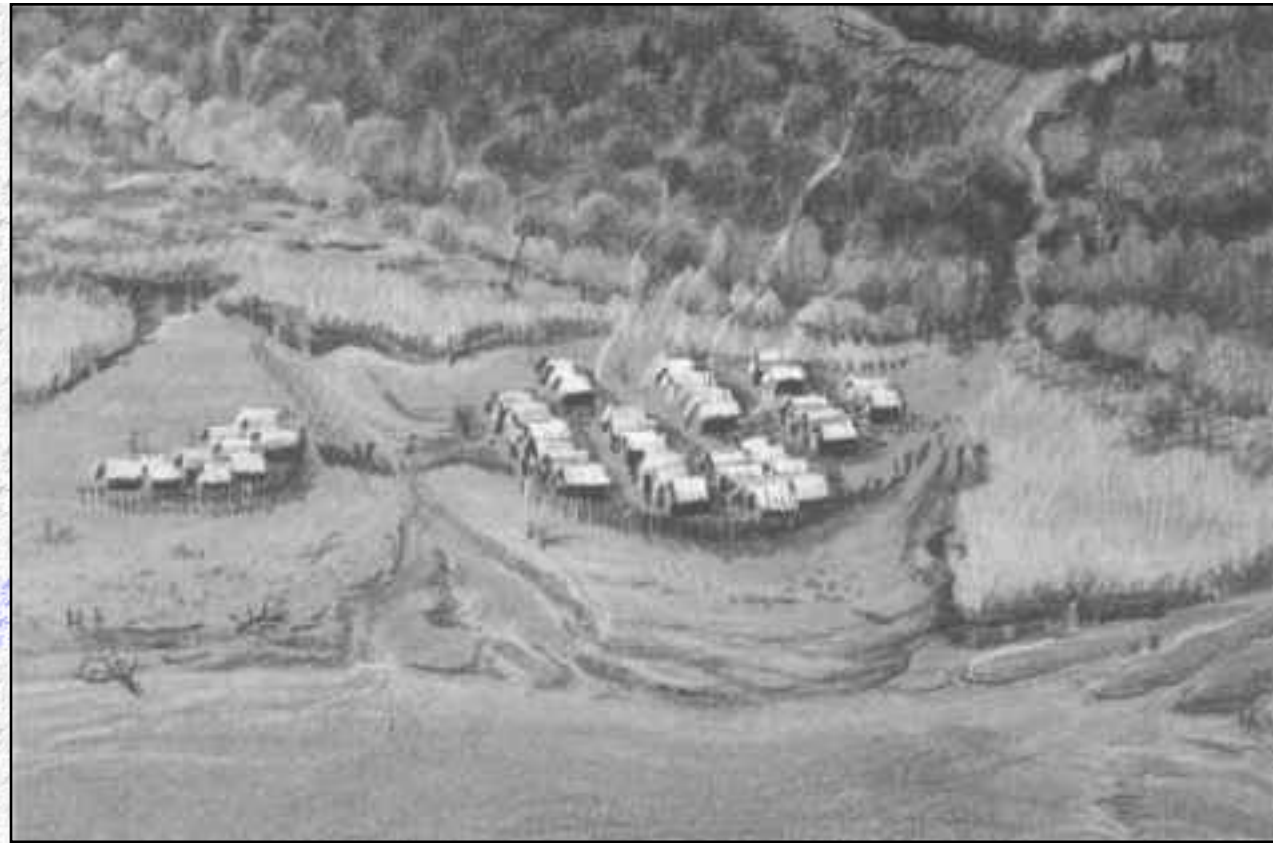
Reconstitution d'un village littoral de la rade de Genève. Dessin Y. Reymond.

Le Léman n'est pas seulement un des plus grands lacs d'Europe, avec sa masse d'eau gigantesque, peuplée d'une multitude d'espèces végétales et animales. C'est aussi un domaine d'attraction pour l'homme, qui a influencé depuis des millénaires son mode de vie, ses activités et ses pensées, en fait tous les éléments qui forment sa culture. Il existe certainement une «culture lémanique», dont l'expression est le résultat de l'intégration des populations riveraines à ce milieu géographique et naturel, face aux contraintes et aux bienfaits qu'il dispense. Depuis la préhistoire et jusqu'à nos jours, l'occupation humaine se concentre sur les rives du Léman, c'est en priorité sur ses côtes que se sont édifiés la plupart des villes et des villages.