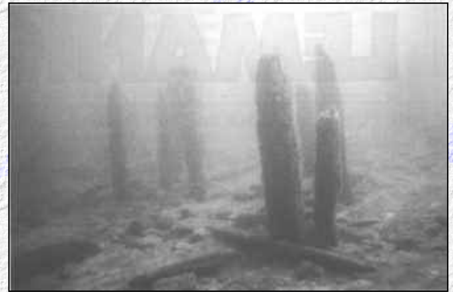
Groupe de pilotis, restes des fondations d'une cabane construite sur la rive émergée, conservés actuellement sur une station littorale de la baie de Morges.

1854. Cette année là, une sécheresse importante provoque la baisse générale du niveau de tous les lacs suisses. Tout d'abord le long des rives du lac de Zurich, mais bientôt dans la plupart des lacs d'Europe, on retrouve de nombreux pilotis, des restes de bois et d'objets archéologiques en os, bois de cerf, pierre taillée ou polie et des fragments de poterie. Ces restes ont très tôt été interprétés comme les vestiges de villages lacustres, c'est-à-dire construits au-dessus du niveau des eaux, à l'image des vues ethnographiques rapportées par les explorateurs du XIX e siècle. Le mythe des «cités lacustres» était né, il va surtout se diffuser en Suisse, avec l'invention d'une «civilisation des palafittes» dont le succès s'accorde au sentiment d'identité nationale qui se développe en cette fin du XIX e siècle.