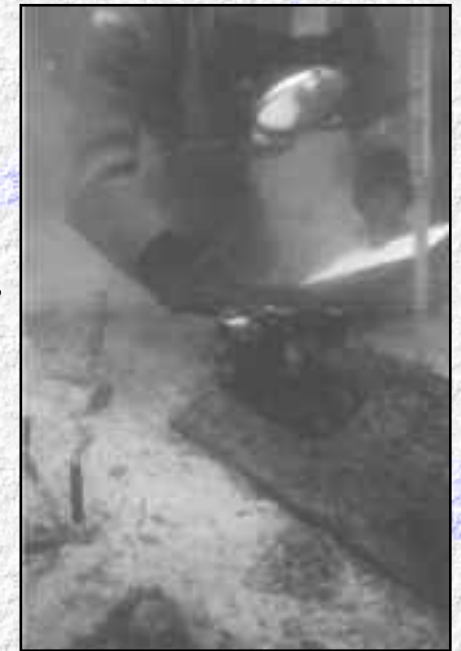
Élément d'architecture en bois étudié sur la station de la Grande-Cité à Morges. Il s'agit d'une semelle de blocage destinée à

Aujourd'hui, nous avons une image très différente des «stations lacustres du Léman», qui remplace celle plus romantique diffusée au début du siècle. Par exemple, la notion de «civilisation des palafittes» est complètement à abandonner. Ainsi, pour ne pas se mouiller, les préhistoriens actuels préfèrent employer le terme de «villages littoraux»