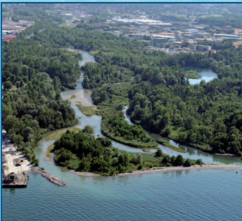
Le delta de la Dranse à l'est de Thonon-les-Bains (réserve naturelle)