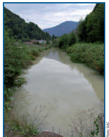
Canal sur la décharge de matériaux inertes du pont de Gys - la Baume