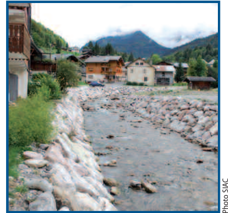
Ruisseau du Malève - Val d'Abondance