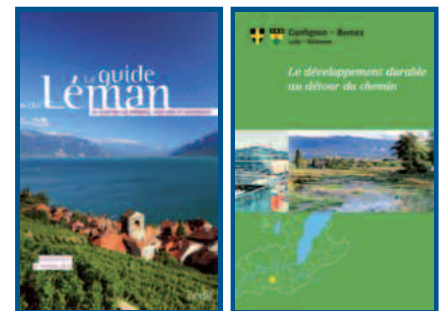
Page réalisée par le secrétariat de l'ASL

Guide Confignon-Bernex pour une jolie promenade instructive teintée de développement durable , de Jean-Bernard Lachavanne, Raphaëlle Juge et Rémi Merle (Ed. ASDD, 2011) vendu au profit de l'Association pour la sensibilisation au développement durable à Genève (ASDD); 1 er volume de la collection « Le développement durable au détour du chemin » qui couvrira l'ensemble du canton de Genève. Prix: CHF 14.—, accessible aux membres de l'ASL et lecteurs de LÉMANIQUES pour CHF 12.— (+ frais d'envoi CHF 1,50 pour la Suisse et CHF 5.— pour la France ou disponible dans les locaux de l'ASL) - www.genevedurable.ch